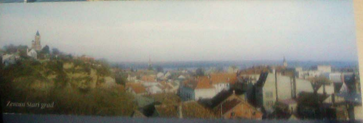
Zemun Stari grad