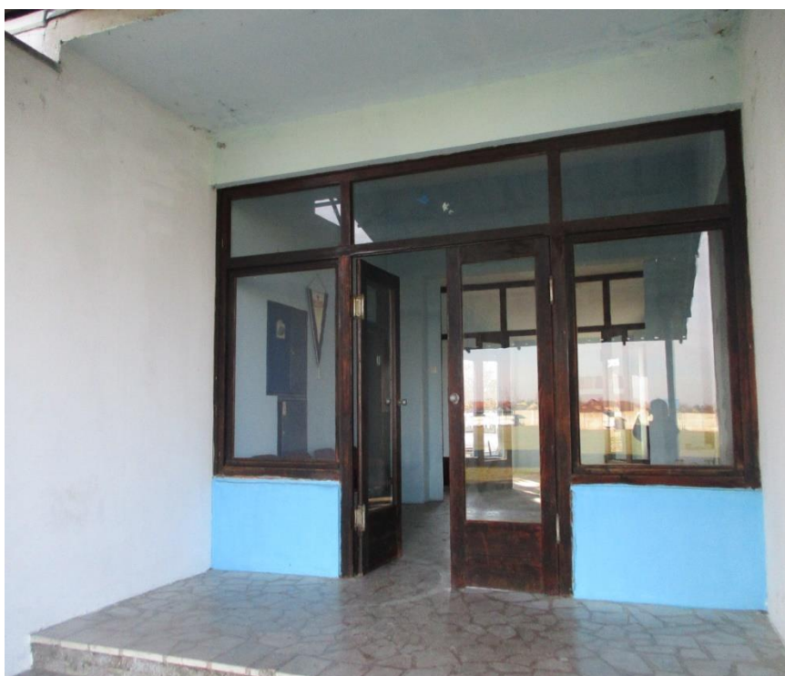
Слика бр. 4 геометрија врата В2