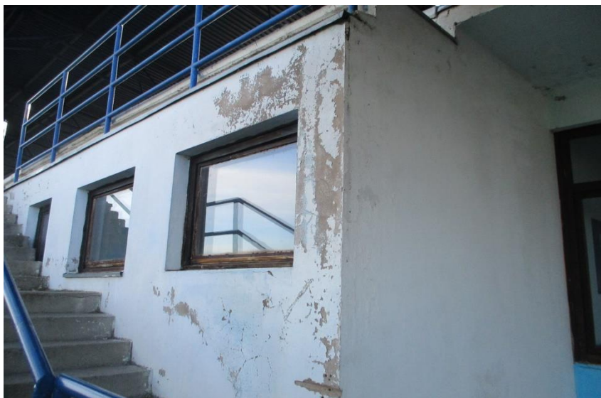
Слика бр. 1 геометрија прозора П1, П2, .