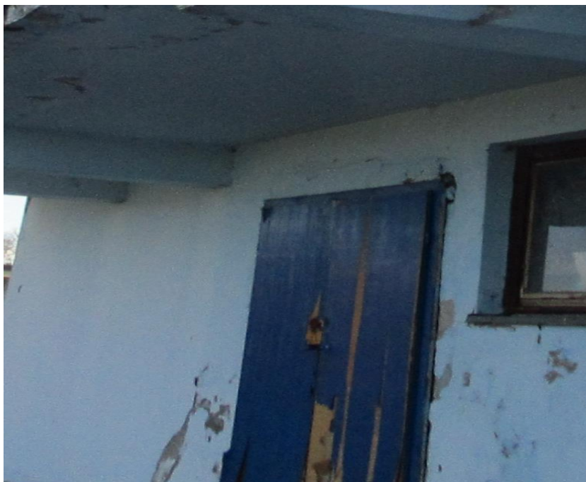
Слика бр. 5 геометрија врата В3,В4