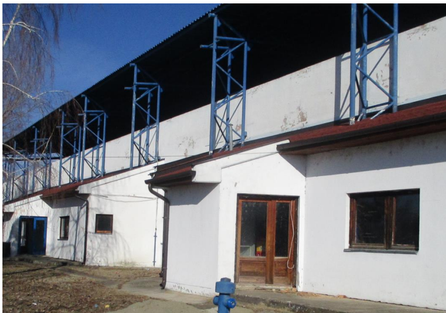
Слика бр. 3 геометрија прозора и врата П7, В1